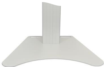
Stahlbodenplatte Art.-Nr.: MSRS-001